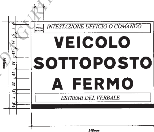
Sigillo per veicoli sottoposti a fermo amministrativo - formato ridotto - da applicare quando non è possibile utilizzare il sigillo in formato normale.

ALLEGATO B al decreto ministeriale relativo alle caratteristiche dei sigilli